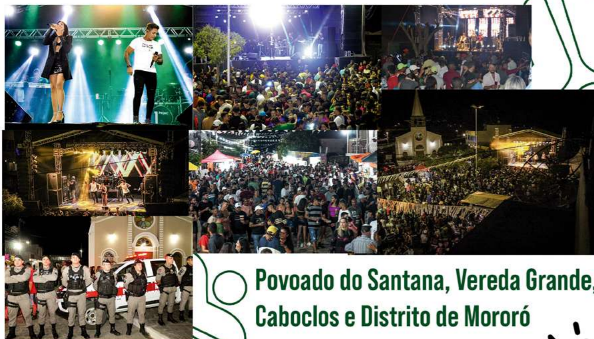
Povoado do Santana, Vereda Grande, Caboclos e Distrito de Mororó

Do Povoado do Santana à Vereda Grande, de Caboclos ao Distrito de Mororó, a comunidade se reuniu para celebrar sua cultura, história e diversidade. A realização de festas nestas comunidades são expressões vibrantes da identidade local, proporcionando momentos de diversão, convívio e celebração.